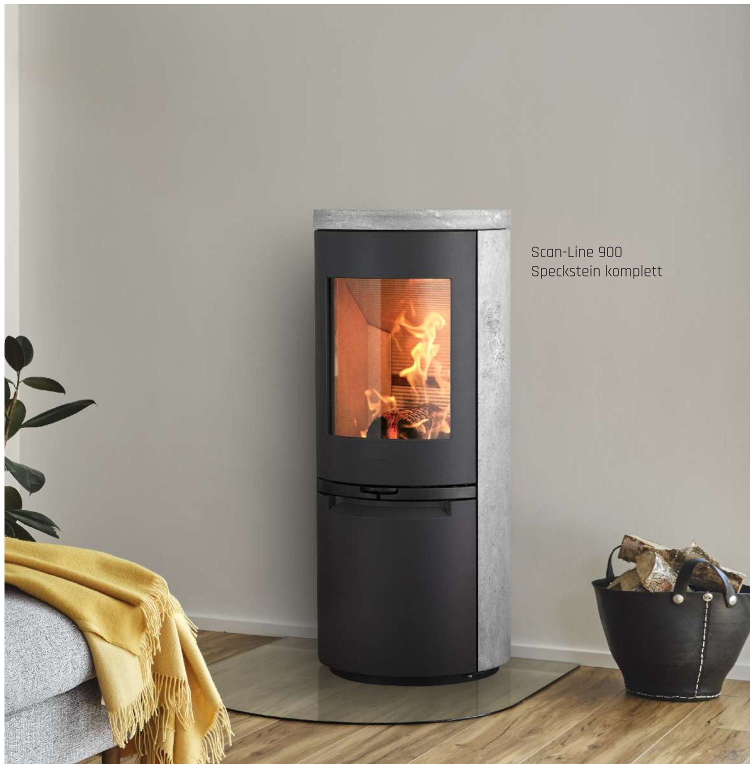
Scan-Line 900 Speckstein komplett