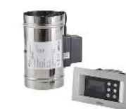
HAC Heta Automatic Combustion Art-Nr. 5032 0102