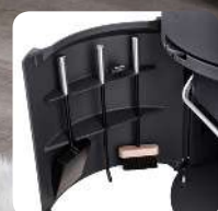
Sockelraum mit 5-Liter-Aschekimer und Kaminbesteck