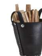
Kaminkorb Ø30 x H30 Art-Nr. 3535 0003