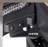
Türarretierung für eine komfortable Reinigung