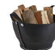
Kaminkorb Ø50 x H30 Art-Nr. 3535 0000